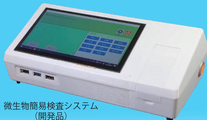
微生物簡易検査システム (開発品)